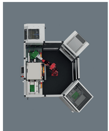
UCMr: UCM demo robot cell with docked UCMi and UCMb for PCB (l. b. & a.) and UCMb for EAS (r. a.) and heating chamber with conveyor (below)