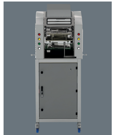
UCM inline – UCM-Einzelmodul erweiterungsfähig zur Modullinie und anbindbar an Roboterzellen qua Standardschnittstelle